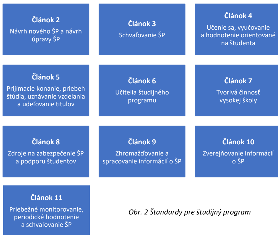
Obr. 2 Štandardy pre študijný program

Štandardy pre študijný program predstavujú súbor požiadaviek, ktorých plnením je podmienené udelenie akreditácie študijného programu a rozhodovanie agentúry o oprávnení vysokej školy vytvárať, uskutočňovať a upravovať študijné programy v príslušnom študijnom odbore a stupni. Tieto štandardy vydáva agentúra a týkajú sa nasledujúcich oblastí: